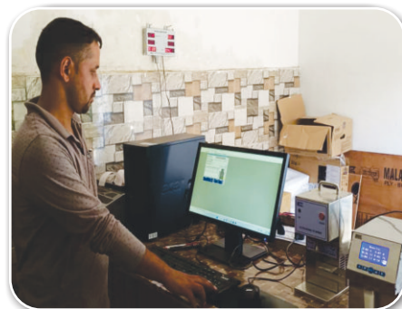
हिमाचल प्रदेश मिल्कफेड, शिमला के अंतर्गत सोसायटी मज़ोली टिपर समिति में दूध संग्रह

इसके अलावा, मध्य, पूर्वी, गुजरात, उत्तरी, राजस्थान, दक्षिणी क्षेत्र से 127 इलेक्ट्रॉनिक मिल्क टेस्टर और मध्य, उत्तरी, गुजरात, राजस्थान दक्षिणी क्षेत्र से 717 मिल्क एनालाइजर के ऑर्डर मिले। इस प्रकार रील अपने इन सिस्टम्स के माध्यम से निरंतर किसानों को सशक्त बनाती आयी है एवं डेयरी क्षेत्र में बदलाव लाने के लिए समर्पित हैं।