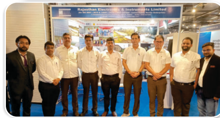
एक्सपो के दौरान रील टीम

रील ने 6 से 8 जुलाई 2024 तक राजस्थान इंटरनेशनल सेंटर, जयपुर में आयोजित भारत सोलर कंपोनेंट एक्सपो 2024 में भाग लिया। इस अवसर पर राजस्थान के माननीय उपमुख्यमंत्री श्री प्रेम चंद बैरवा जी ने रील के स्टॉल का उद्घाटन किया। डॉ. पी. एन. शर्मा ने उपमुख्यमंत्री को रील के उत्पादों, परियोजनाओं और राजस्थान के साथ-साथ देश में इसकी उपस्थिति के बारे में जानकारी दी। राजस्थान के उपमुख्यमंत्री ने सोलर एप्लीकेशन और सरकार द्वारा शुरु की गई परियोजनाओं में रील के योगदान की सराहना की।