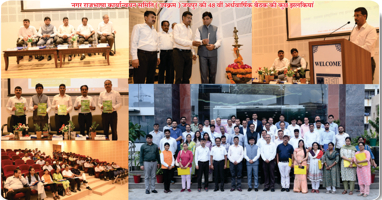
नगर राजभाषा कार्यान्वयन समिति (उपक्रम) जयपुर की 48 वीं अर्धवार्षिक बैठक की कुछ झलकियां

Editorial : Chief Editor - Mr. Neeraj Saxena, Editor - Ms. Loveena Babbar Email : insights@reil.co.in