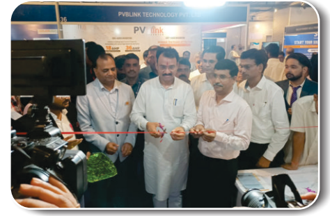
राजस्थान के उप मुख्यमंत्री रील स्टाल का उद्घाटन करते हुए

गुजरात में तरनेतर मेले के दौरान रील के डेयरी उत्पादों का प्रदर्शन