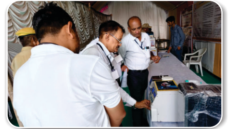
तरनेतर मेले के दौरान रील उत्पाद का प्रदर्शन

कंपनी ने 06.09.2024 से 08.09.2024 के दौरान थानगढ़, जिला:-सुरेन्द्रनगर में आयोजित तरनेतर मेले में भाग लिया, जिसका आयोजन पशुपालन विभाग, गांधीनगर द्वारा किया गया था। तरनेतर मेले के दौरान कंपनी के उत्पाद का ग्रामीण समाज के समक्ष सफलतापूर्वक प्रदर्शन किया गया।