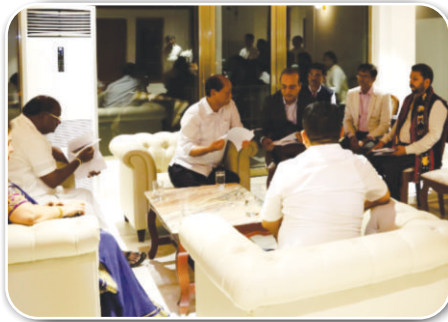
बाएं से दाएं: सबसे बाएं माननीय मंत्री भारी उद्योग एवं इस्पात, माननीय CM नागालैंड, CMD CCI, MD REIL, CMD B & R, MHI के निजी सचिव

पूर्वोत्तर राज्यों में REIL, EPIL, CCI और B&R CPSEs के लिए प्रासंगिक क्षेत्रों में व्यवसाय की संभावनाओं हेतु MHI द्वारा दीमापुर, गुवाहाटी में बैठक आयोजित की गई। बैठक माननीय मंत्री भारी उद्योग एवं इस्पात और माननीय CM, नागालैंड की अध्यक्षता में आयोजित की गई। MD, REIL ने पूर्वोत्तर राज्य में कंपनी द्वारा पहले से किए गए कार्यों को प्रस्तुत किया और सोलर, ड्रोन, स्मार्ट क्लासरूम, IT/ITes, CCTV, EV और डेयरी इंफ्रास्ट्रक्चर को मजबूत करने जैसे व्यावसायिक क्षेत्रों में उत्तर पूर्व में काम करने के लिए कंपनी के अवसरों और इच्छा को साझा किया।